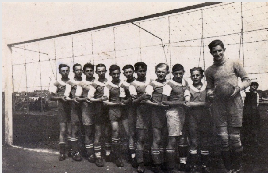
Une des premières équipes juniors du F.C. BBM.

Nous ne voudrions pas terminer cette rétrospective sur les débuts du football dans la localité de Muhlenbach sans mentionner une date-clé des Blue Boys Muhlenbach qui a sûrement contribué à consolider les fondements du club.