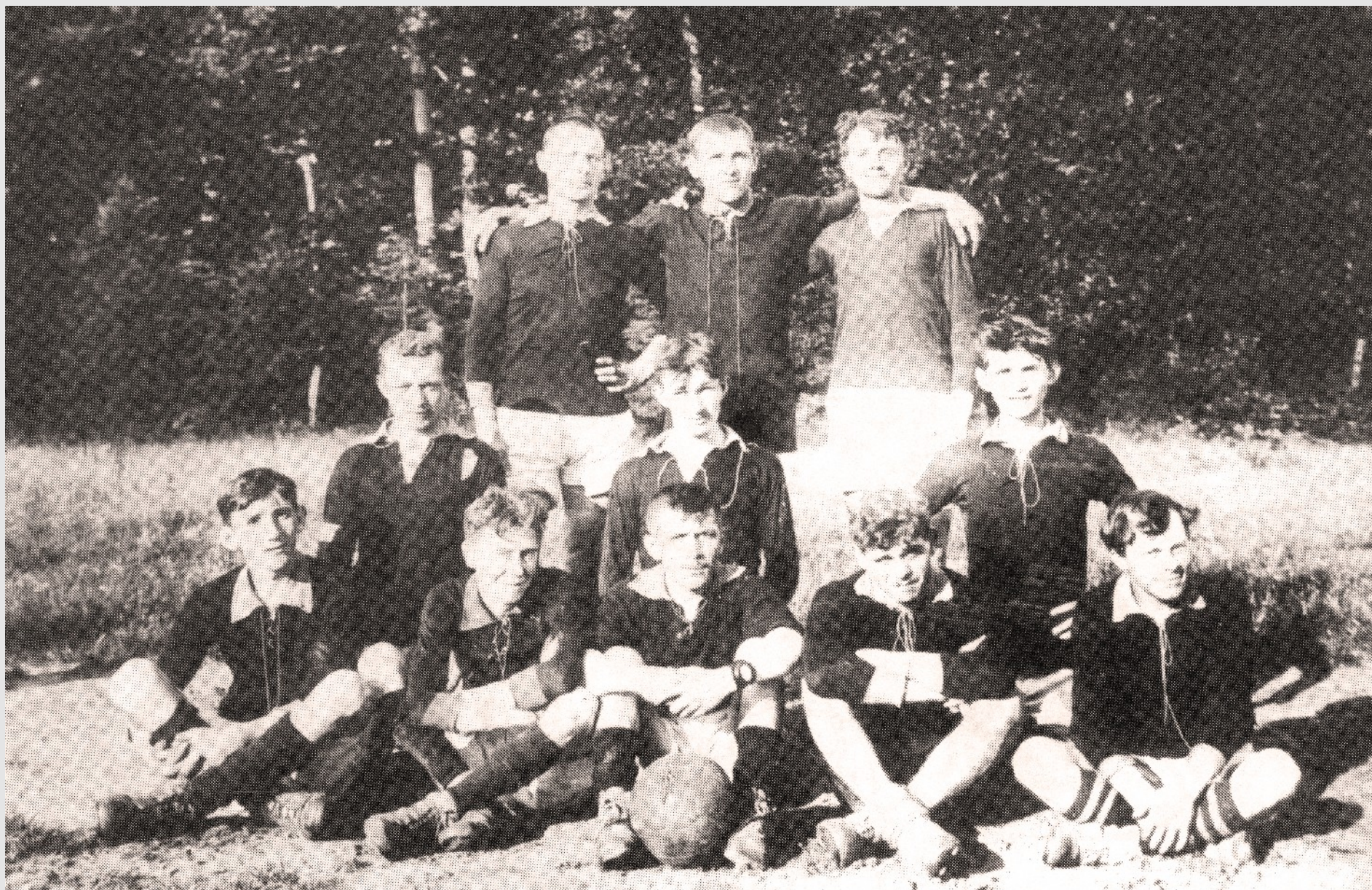
La section football du club cycliste la Pédale Muhlenbach vers 1918.