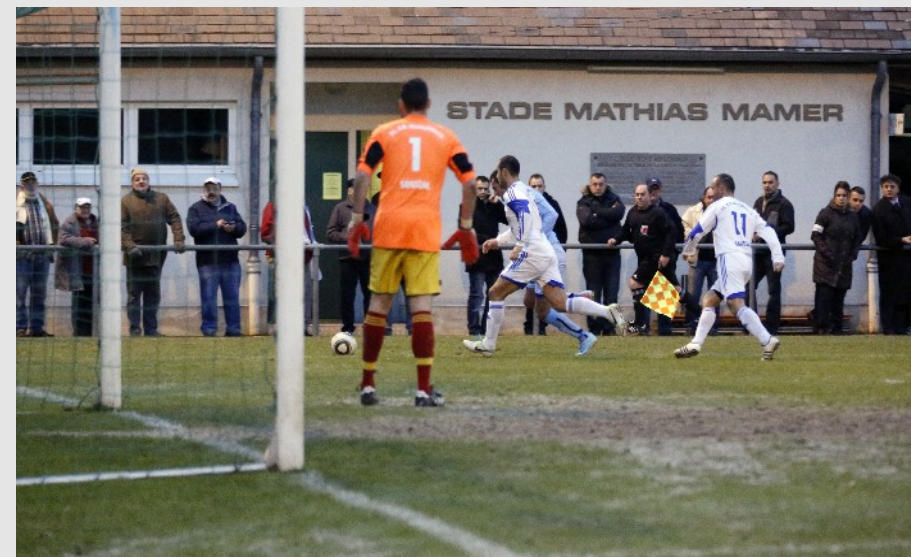
En 1 / 16e finale de la Coupe de Luxembourg le BBM a accueilli le RFCUL.