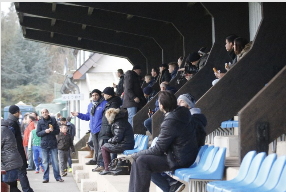
Actuellement l'équipe première du FC Blue Boys Muhlenbach joue en promotion d'honneur. Elle occupe la neuvième place au classement général.

Aujourd'hui, le club des BBM existe toujours, tout comme le stade Mathias Mamer. Au cours de son existence, le terrain a fait l'objet de nombreux travaux d'aménagement (réalisés cette fois-ci par la commune) et avec sa tribune couverte, son club-house, ses installations sanitaires et le cadre verdoyant du Baumbusch, il se présente comme un stade exceptionnel dont non seulement le club mais également les habitants du quartier, sont fiers.