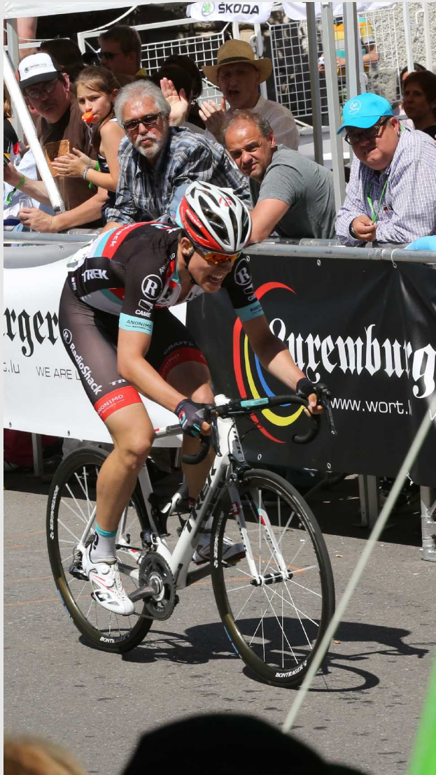
De Bob Jungels huet seng Konkurrenten ofgehaang.