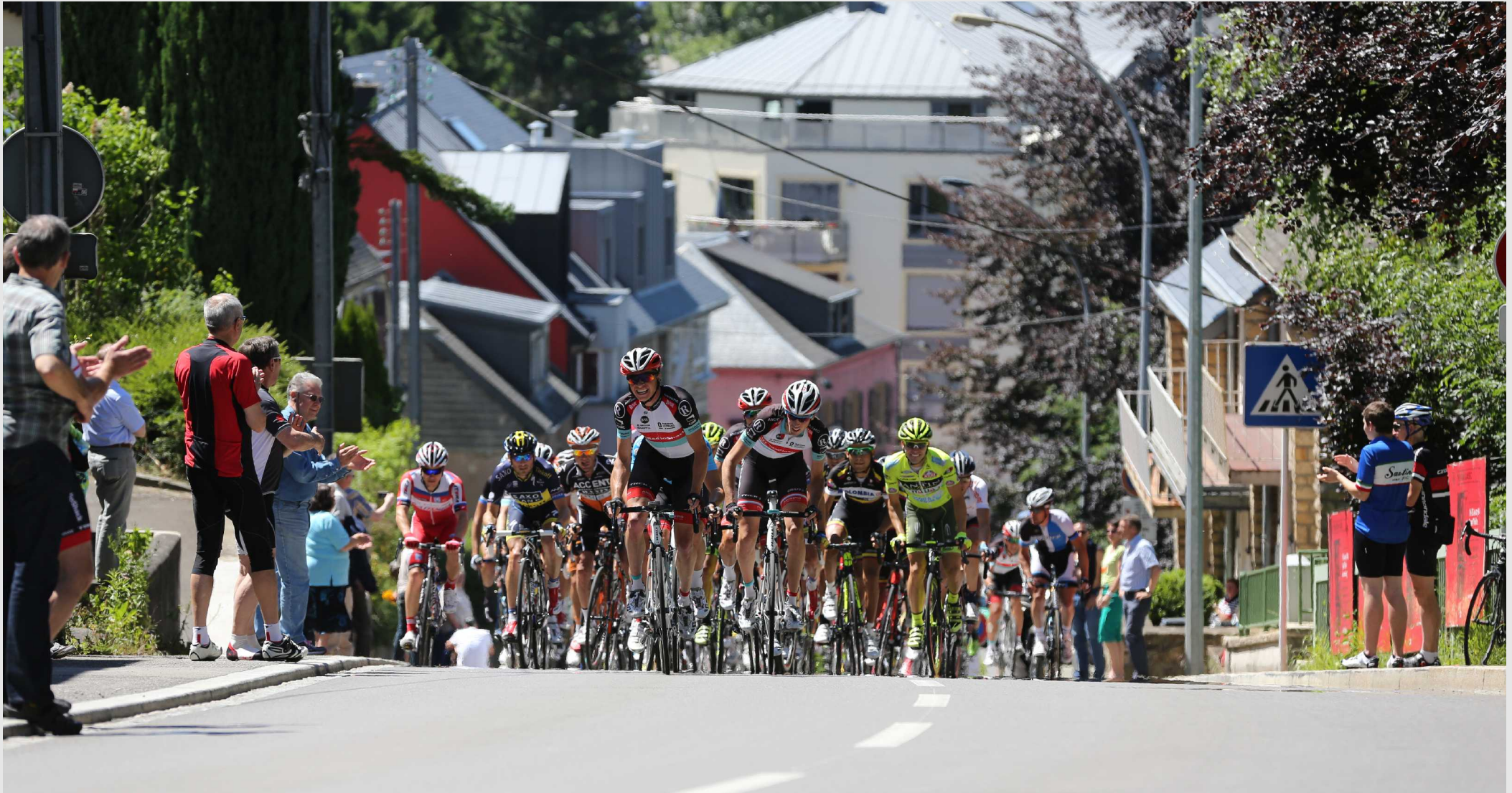
De Peloton am Pabeierbi erg.