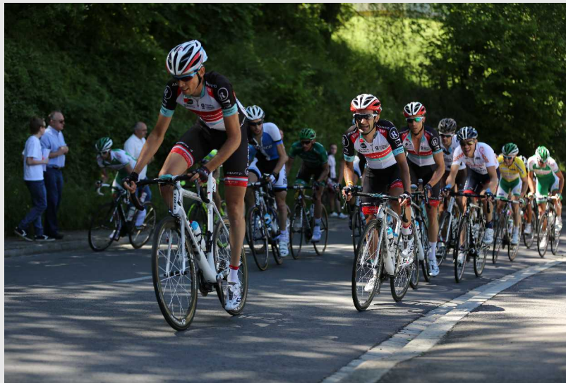
D'Coureuren am Pabeierbiërg.